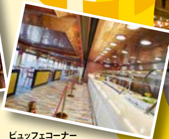
ビュッフェコーナー お好きな時間に自由に 気軽にお食事が出来ます。