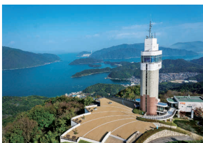
五老スカイ タワー OP 舞鶴湾、舞鶴 市街地が一望 できる舞鶴屈 指のロケーシ ョン

伊根の舟屋・天橋立めぐり II 傘松公園(日本三景天橋立展望所)、 伊根湾めぐり遊覧船、 道の駅舟屋の里 伊根 ◆所要時間:約8.5時間 ◆お食事:昼食付