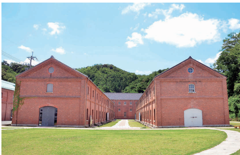
舞鶴赤れんがパーク OP 旧海軍舞鶴鎮守府の軍需品等の保管倉庫で、重要文化財に指定されている