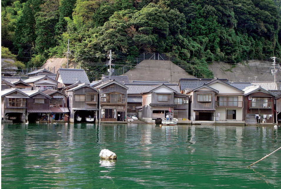
伊根の舟屋 OP 周囲5キロメートルの湾に沿って230軒あまりの舟屋が立ち並ぶ