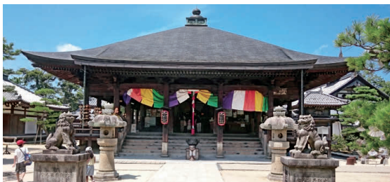
智恩寺 OP 「文殊堂」とも呼ばれ、知恵の神様・ 文殊菩薩を祀る日本三文殊の一つ