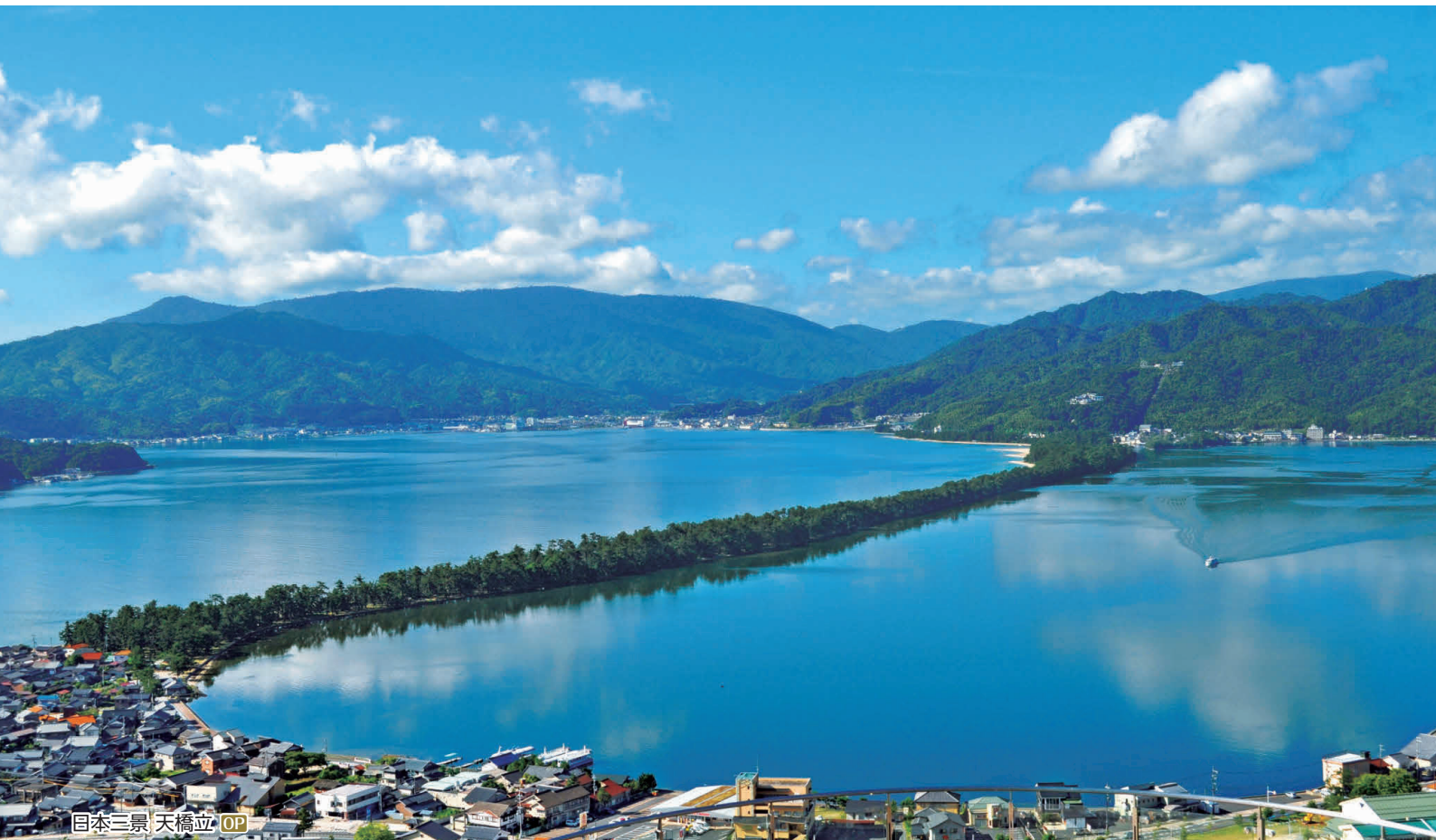
日本三景 天橋立 OP