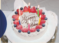
パティシエ特製 パースデーケーキ